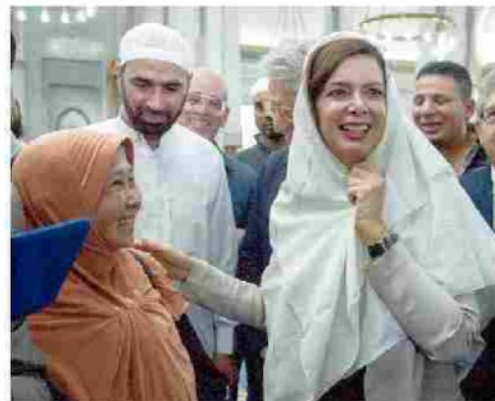
In visita alla moschea di Roma, il 17 ottobre dello scorso anno