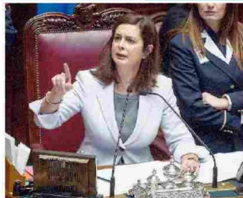
Sullo scranno di presidente della Camera, in carica dal 16 marzo 2013