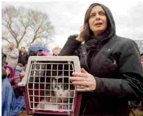
Alla Festa degli animali, a Roma lo scorso 18 gennaio